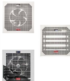
Placas de piso activo