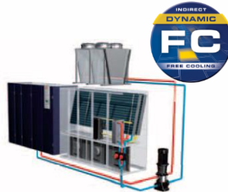
GE System Indirect Free Cooling