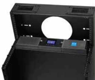
UPS 9PX montado verticalmente en el MiniRaQ de Eaton, perfecto para lugares confinados

*Costo de batería y mano de obra para un reemplazo.