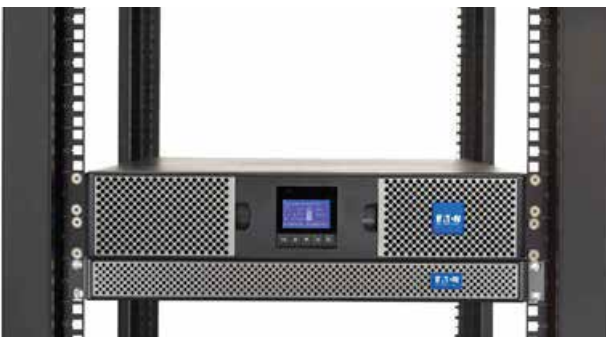
2U UPS con 1U EBM en rack de 4 postes

Esta tarjeta de interfaz de red mejora la confiabilidad del sistema de alimentación al proporcionar advertencias de problemas pendientes y ayudar a realizar un apagado ordenado y elegante de los servidores y el almacenamiento.